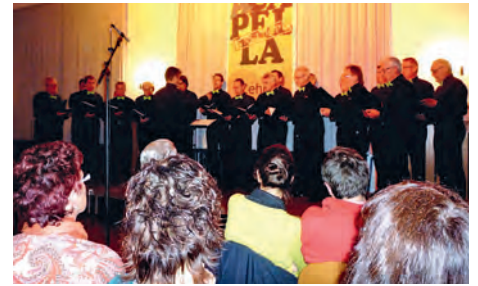
Men in Mood

Beim verlassen der Bühne mussten wir einige geworfene BH's einsammeln. Zum Leidwesen des fleißigen Sammlers bestanden die Damen auf die Rückgabe der Wäschestücke.