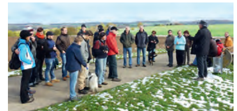
Gruppenbild Mögliche Windkraftstandorte in Weingarten