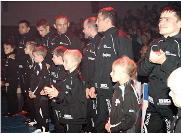
Die Bambinis des SVG durften mit den Profis einmarschieren

Was im Fußball schon lange üblich ist und was jeder Verein gern und stolz tut, hatte am Samstag auch ausnahmsweise beim „SV Germania“ Einzug gehalten: Die Bundesligamannschaft präsentierte den Nachwuchs, den „Mattenwirbel“. Letzter Kampfabend in der Kleiberit-Arena. Die bekannte Musik zum Einmarsch der Athleten ertönte, die Athleten aus Triberg waren schon da. Und dann kam die Überraschung. Stolz und freudig liefen die Jüngsten der Jugendabteilung des SVG, die sich „Mattenwirbel“ nennt, an der