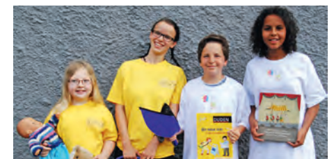
Aktion der Taschengeldbörse