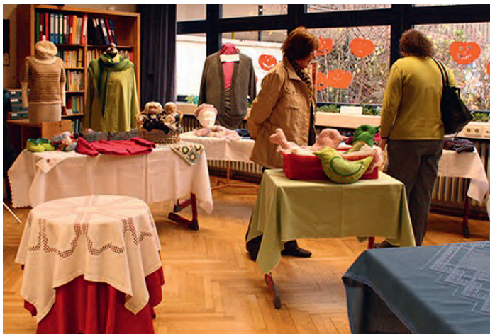
Mehr als kunstvoll sind die Tischtücher und Schals gearbeitet

Handarbeitskunst vom Allerfeinsten präsentierte die Weingartener Ortsgruppe des DHB-Netzwerk Hausfrau am Sonntagnachmittag in einer Ausstellung in der Turmbergschule. Die beiden Schwerpunkte waren Stricken und Hardanger-Sticken, beides unglaublich kunstreich und aufwendig ausgeführt.