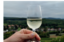
Genuss mit Sti(e)l

Am Samstag bieten die Swinging Voices des Liederkrans 1862 Weingarten e. V. wie in den letzten Jahren auf ihrem Stand beim Weingartner Weihnachtsmarkt Köstlichkeiten und Selbstgemachtes zum Verkauf an.