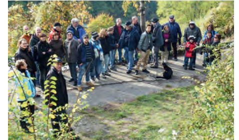
Gruppenbild vor renaturiertem Steinbruch

Alle Teilnehmer waren darin einig, mit der Wanderung den Reiz der heimischen Gemarkung und ein besonderes kulinarisches Ereignis intensiv erlebt zu haben.