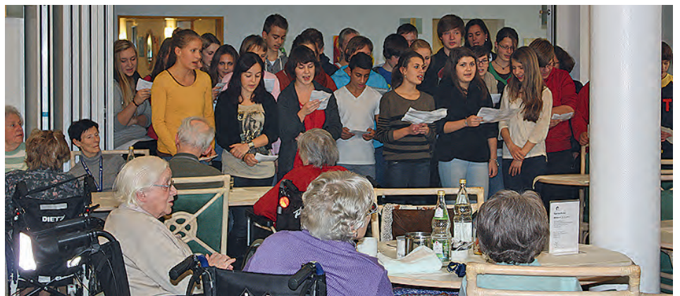
Seniorenachmittag, gestaltet von den Firmanden

Zusätzlich traf sich eine Bastelgruppe, die für jeden der Senioren eine bunte Blume aus Pappe herstellte, die während des Konzerts verteilt werden sollten. Wir klebten und schnitten fleißig, bis 60 Blumen fertig waren. Einzelne Firmanden