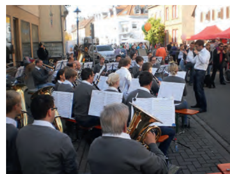
... beim Verkaufsoffenen Sonntag in Weingarten