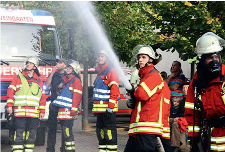
Der Löscheinsatz war nur ein Teil des vielschichtigen Szenarios der Übung

Mit einer eindrucksvollen Jahreshauptübung hat die Weingartener Feuerwehr zahlreichen Zuschauern ihre Schlagfertigkeit demonstriert. Die Übungsannahme war ein klassischer Brandfall mit Menschen in akuter Gefahr. Und das mitten im Ort, womöglich zu einer Tageszeit mit viel Verkehr auf der stark befahrenen Bundesstraße. Durch Abdichtenarbeiten auf dem Flachdach des evangelischen Gemeindehauses war die Dachpappe in Brand geraten. Zeitgleich fand in den darunterliegenden Räumen eine Veranstaltung statt. Aufgrund der baulichen Beschaffen-