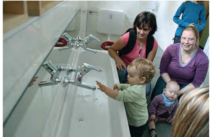
Selber Hände waschen können schon die Kleinsten am niedrig angebrachten Waschbecken. Selbständigkeit wird im „Blauland“ groß geschrieben

klärt die Leiterin den Eltern. Zahlreich waren diese erschienen, mit und ohne Kinder, um sich die neuen Räume anzuschauen und vor allem, um sich über das Konzept zu informieren. Der Kern des Konzepts ist ein mit ein paar Eckdaten strukturierter Tag, der feste Rituale hat und feste Zeiten und trotzdem an den Interessen der Kinder orientiert ist. Der Tag beginnt mit einer einstündigen „Bringzeit“ ab 7.30 Uhr. Um 8.30 Uhr ein gemeinsames Frühstück. Dreimal pro Woche geben es die Eltern mit, zweimal richten es die Erzieherinnen. Dann haben auch klei-