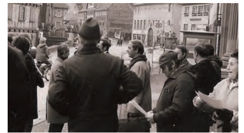
1980, Bürger, Gemeinderäte und Pressevertreter vor dem Rathaus von Weingarten