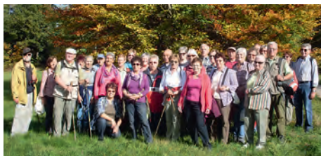
Herbstsonne auf dem Dobel