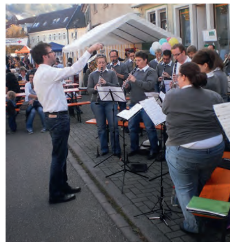
Eindrücke von unserem Auftritt...