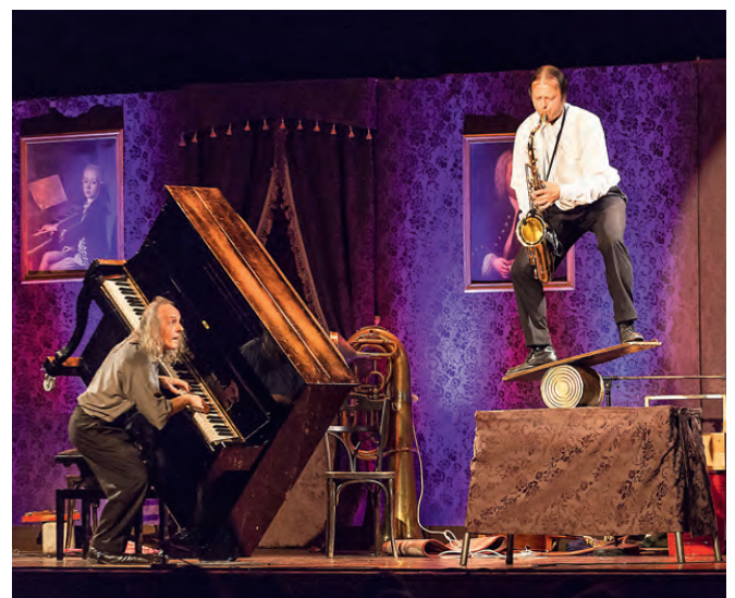
Strapazierten die „Lachmuskeln“ des Publikums „Gogol und Mäx“

2011 mit ihren Konzertparodien mehr als verdient haben, für den wunderschönen, kurzweiligen und humorvollen Abend.