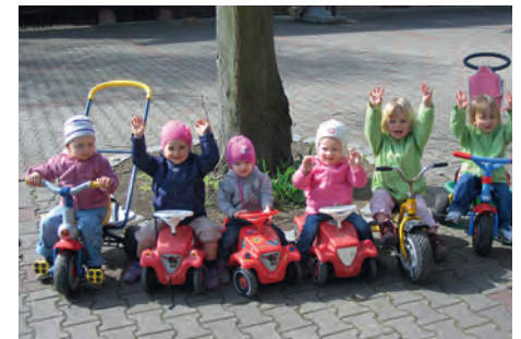
Mini Club Kids

Wir freuen uns auf Ihren Anruf (Tel: 9479390) oder schreiben Sie uns eine E-Mail unter Allerdings-Weingarten@web.de