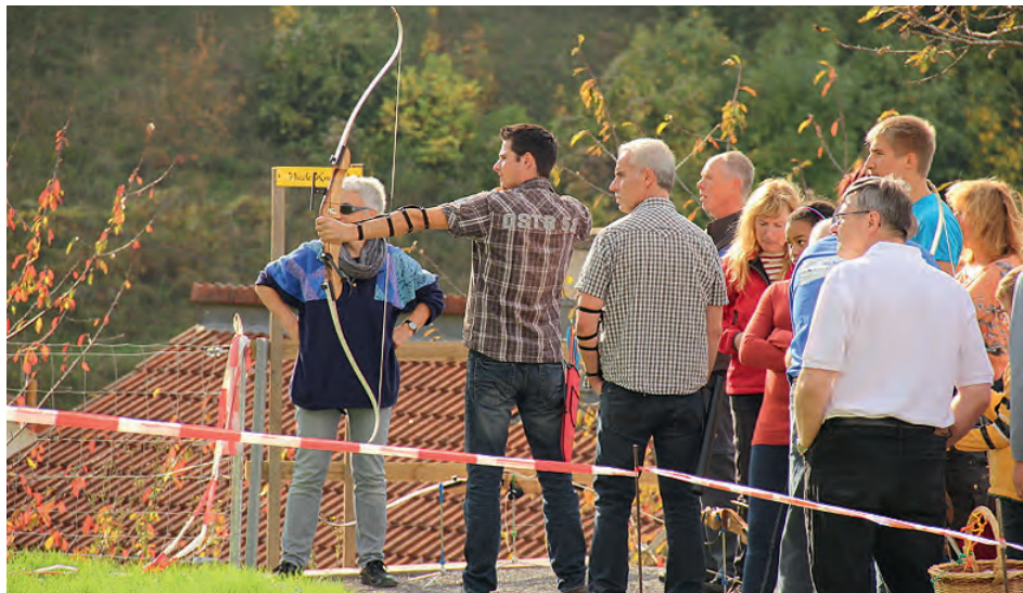
Bogenschießen für Jedermann

Wer der neue Bürgerkönig bzw. Bürgerkönigin ist wird jetzt noch nicht verraten. Von den 23 Teilnehmern konnten sich jedoch 14 für den Königsschuss qualifizieren. Man darf also gespannt sein. Die Bekanntgabe des Bürgerkönigs bzw. -königin sowie die Übergabe der Preise erfolgt in der Königsfeier am 17. November 2012 in der Kleiberit-Arena.