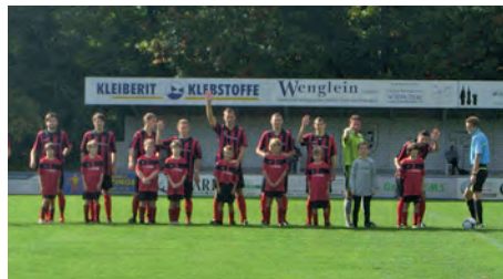
Die E2 beim einlaufen mit den „Großen“ am 07.10.2012

A-Jugend: VfB Grötzingen : SG Weingarten/Blankenloch um 19:00 Uhr