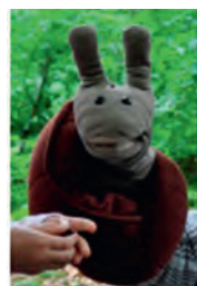
Schnecke, der Wurzelkrabberbegleiter

Immer montags - bei fast jedem Wetter - von 9.30-11.00 Uhr treffen sich die 1-2 jährigen Wurzelkrabber der AGNUS-Jugend Weingarten am Parkplatz des Weingartener Baggersees. Von dort geht es gemeinsam zum Waldsofa, wo schon eine hungrige Schneckenhandpuppe wartet, die gleich von den Kindern und ihren Müttern gefüttert wird. Nach der Ankunft und einem Begrüßungslied wird eine gemeinsame Aktion zum Thema