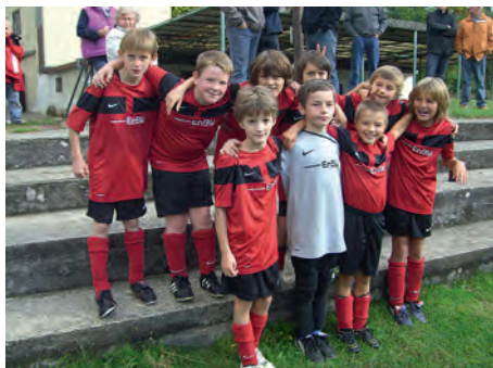
Unsere E2 nach dem 11:2 gegen JVF Stutensee

Turn- und Sportverein 1880 Weingarten e. V.