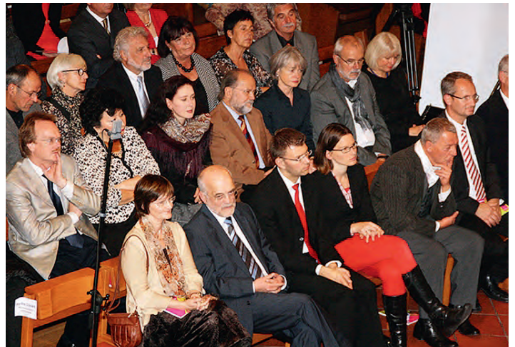
In der evangelischen Kirche fand das Abschlusskonzert und damit zugleich die Finalrunde des Wettbewerbs der Sparda-Bank statt