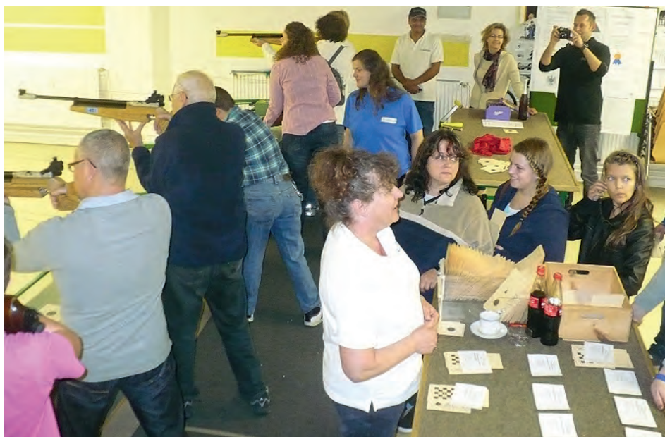
Großer Andrang in der Schießhalle

Der Schützenverein bedankt sich herzlich bei allen Teilnehmern und Helfern. Alle Ergebnisse und Bilder zum Schießsportevent finden Sie auf unserer Homepage www.svweingarten.com .