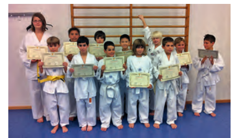
Die Prüflinge mit ihrer Urkunde