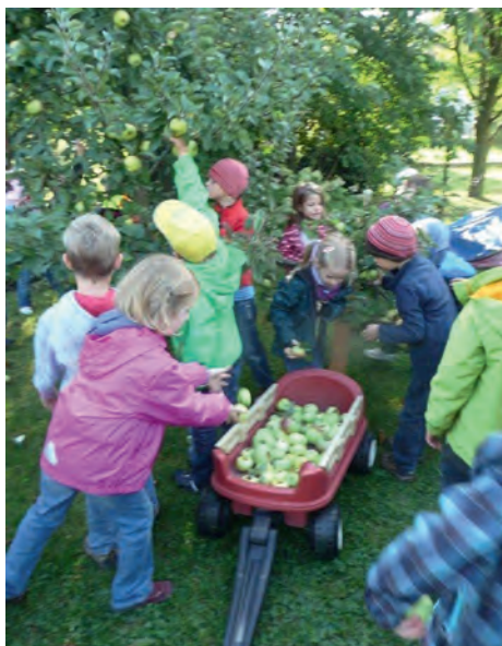
Bild Apferlerte Klasse 1a