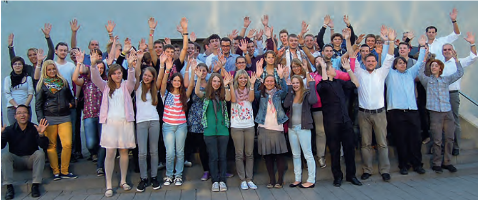
Neuapostolische Kirche: Jugendtag