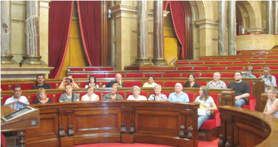
Besuch im Parlament von Katalonien

Am Donnerstagmorgen konnte die lang ersehnte und mit Spannung erwartete Reise nach Olesa de Montserrat losgehen. Auch dieses Jahr sind einige neue Austauschinteressierte dazu gestoßen, die sich um 10:00 Uhr am Treffpunkt an der Walzbachhalle eingefunden hatten und herzlich vom festen Stamm der Reisenden nach Olesa begrüßt wurden. Mit dem Flugzeug ging es vom Airport Karlsruhe/Baden-Baden nach Girona, wo uns auch schon die Mitglieder des Partnerschaftskomitees aus Olesa erwarteten, um uns ins Rathaus von Olesa de Montserrat zu begleiten.