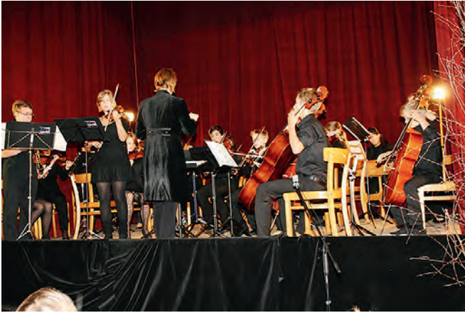
„Die Telemänner“ aus Stuttgart spielten Barockmusik für Kinder

Wer jemandem etwas schmackhaft machen will, sollte zum besten Rezept greifen. Die „Weingartner Musiktage“ hatten für ihren Kindernachmittag dieses Mal kein Puppentheater, sondern ein Barockmusikensemble gewählt. Das internationale Kinder-Barockorchester aus Stuttgart, „Die Telemänner“, war im „Goldenen Löwen“ aufgetreten. Die Ausführenden, eigentlich nicht mehr Kinder, sondern hoch motivierte und handwerklich schon fast perfekte Jugendliche zwischen elf und 17 Jahren, so die selbstgewählte Aufgabe, wollen für die Jüngeren Vorbilder sein. Sie spielten nicht irgendwelche, sondern die