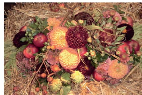
Herbstlicher Blumenschmuck auf der Landesgartenschau.