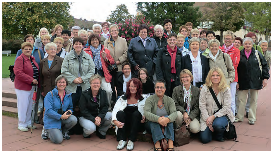
Herbstlicher Blumenschmuck auf der Landesgartenschau.