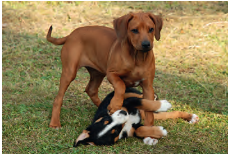
Auch Balgen gehört zum Lernen