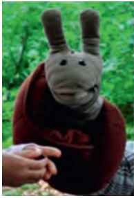
Schnecke, der Wurzelkrabberbegleiter

Die Arbeitsgemeinschaft Natur- und Umweltschutz bietet Gruppen für Kinder an, in denen sie die Natur erfahren und schätzen lernen und an den Natur- und Umweltschutz herangeführt werden können.