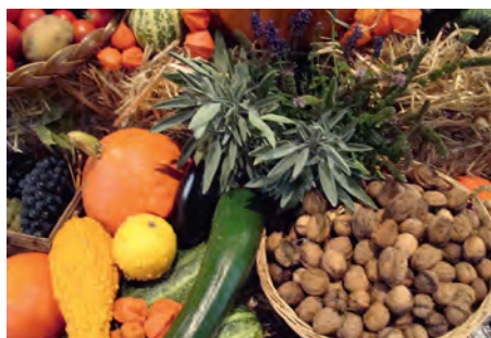
Erntedankaltar 2012-gestaltet von den Firmanden