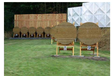
Jedermannsschiessen auf dem neuen Bogenschießplatz