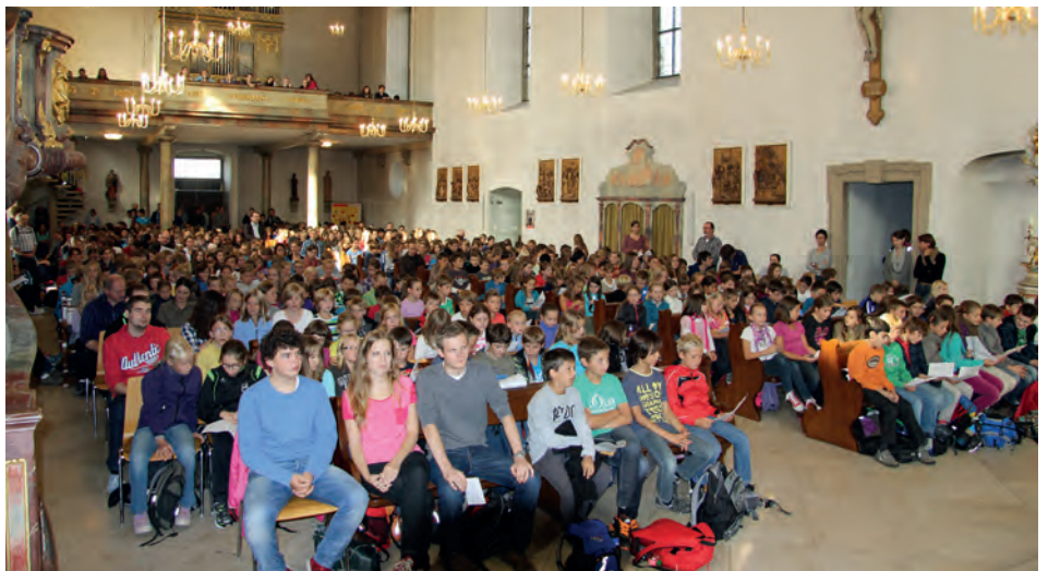
„Einen neuen Aufbruch“ wagt die Schulfamilie des Gymnasiums St. Paulusheim Bruchsal bei ihrer traditionellen Schülerwallfahrt nach Ubstadt zum Auftakt des neuen Schuljahres.

Für die 132 Schülerinnen und Schüler der fünften Klassen war die erste Schulwoche ebenfalls ein Aufbruch in einen neuen Lebensabschnitt. Erstmals in der Geschichte des St. Paulusheims wurden fünf neue Klassen aufgenommen. Entgegen der demographischen Entwicklung verzeichnen die katholischen Schulen im Südwesten weiterhin eine große Nachfrage. Träger des Gymnasiums St. Paulusheim ist die Schulstiftung der Erzdiözese Freiburg. Diözesanweit besuchen rund 12.500 Schülerinnen und Schüler eine Schule in katholischer Trägerschaft. Dennoch habe die Nachfrage die Kapazitäten überstiegen.