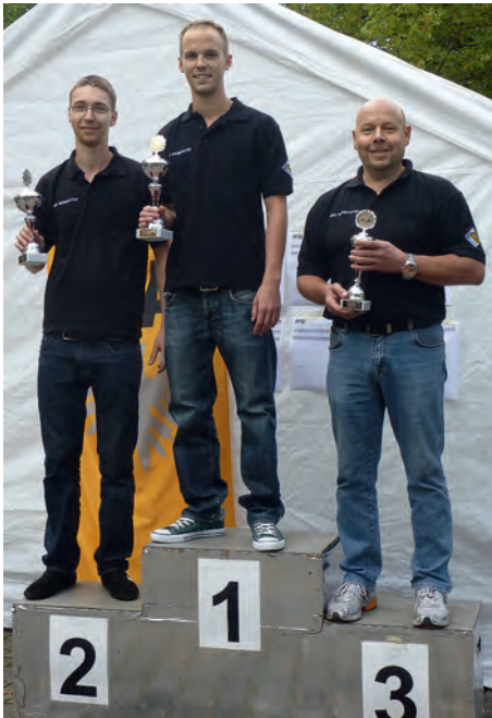
Der MSC Weingarten fährt geschlossen aufs Podium!

vertrautes Bild, jedoch mit anderer Besetzung. Sebastian fuhr seinen 1. Saisonsieg ein, Ludwig fuhr auf P2 und Jürgen machte den Erfolg mit P3 perfekt.