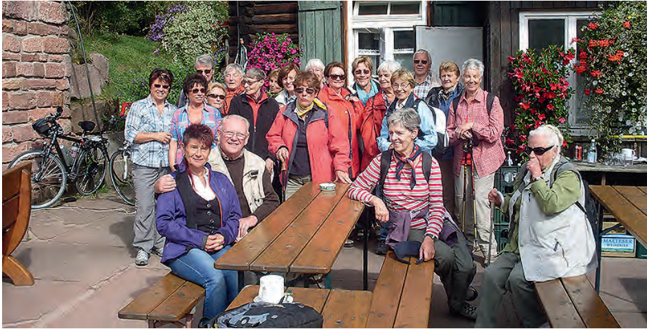
Einkehr bei der Grünhütte

auf den Weg zur „Grünhütte“. Vorbei an der Unterstandshütte „Fünf Bäume“ wanderten wir auf dem fast ebenen Herrmannsweg. Nach der Einkehr ging's frisch gestärkt weiter. Nach kurzem Anstieg, vorbei an der Unterstandshütte „Weißenstein“, erreichten wir den Bohlenweg, der mitten durch das Naturschutzgebiet zwischen dem kleineren Hornsee und dem Wildsee führte. Bergab erreichten wir dann Kaltenbronn.