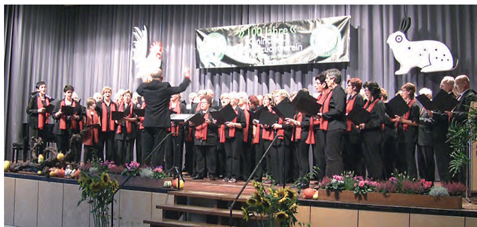
Der gemischte Chor des Gesangvereins Frohsinn Weingarten bei der Jubiläumsfeier des Kaninchen- und Geflügelzüchtervereins

Sie brachten ihn sicher an Land, forderten ihn auf, sich möglichst wenig zu bewegen und alarmierten sofort die ehrenamtlichen Helfer an der DLRG-Rettungswache. Von dort fuhr unverzüglich das Motorrettungsboot mit einem Notarzt und zwei Sanitätern zur abseits der Badesrände gelegenen Unfallstelle. Dort angekommen bestätigte der Notarzt der DLRG den Verdacht auf eine Halswirbelsäulenverletzung. In der nun folgenden Versorgung zahlten sich zahlreiche Übungen der DLRG-Helfer speziell für diesen Unfallmechanismus aus. Die Halswirbelsäule wurde manuell und mit einer Halskrause ruhiggestellt, dann wurde der Patient auf ein spezielles Wirbelsäulenbrett gelagert. Da ein schonender Abtrans-