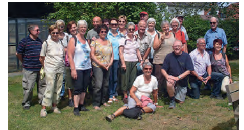
Im Vogelpark in Staffort

Frisch gestärkt - zum Schluss ein Schleck-eis - wanderten wir durch Feld und Wald über die Stafforter Autobahnbrücke zurück. Alle waren der Meinung auch in der näheren Umgebung gibt es schöne „Fleckchen“. Nächste Seniorenwanderung ist am Donnerstag, 20.09.2012. Näheres in der TBR.