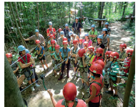
Spannung vor dem großen Klettern

Die Resonanz der Kids war unisono: nächstes Jahr wieder!