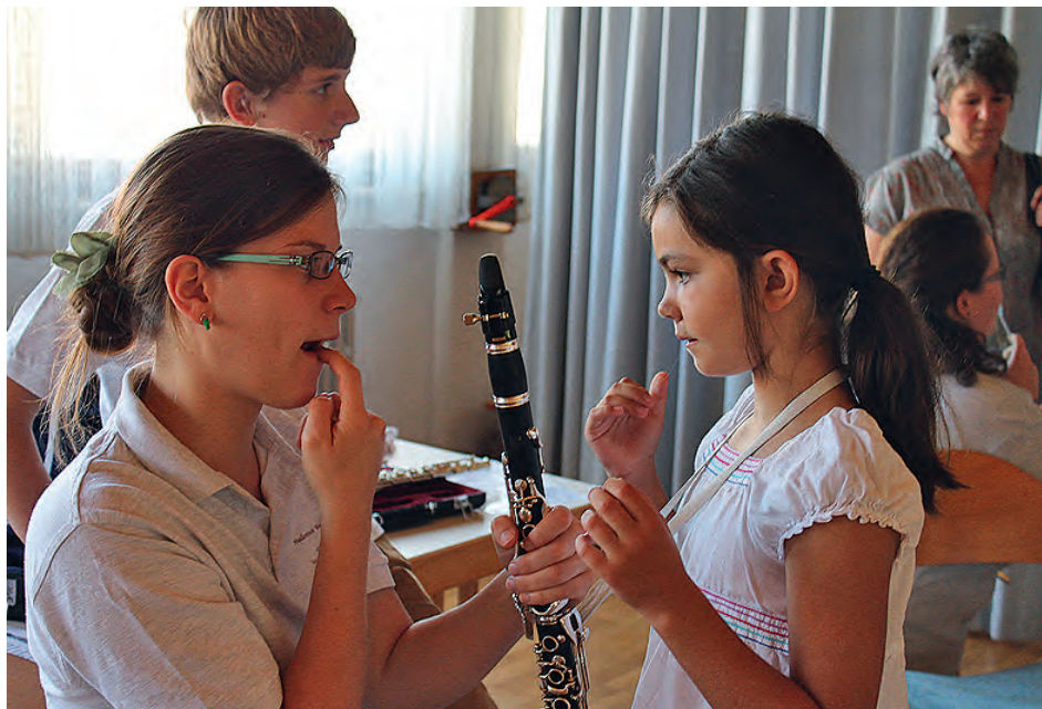
Für Fragen standen erfahrene MusikerInnen bereit.

Email: vereinsjugend@musikverein-weingarten.de. Aktuelle Informationen über den Verein, Auftritte und Vereinsfeste gibt es auf www.musikverein-weingarten.de .