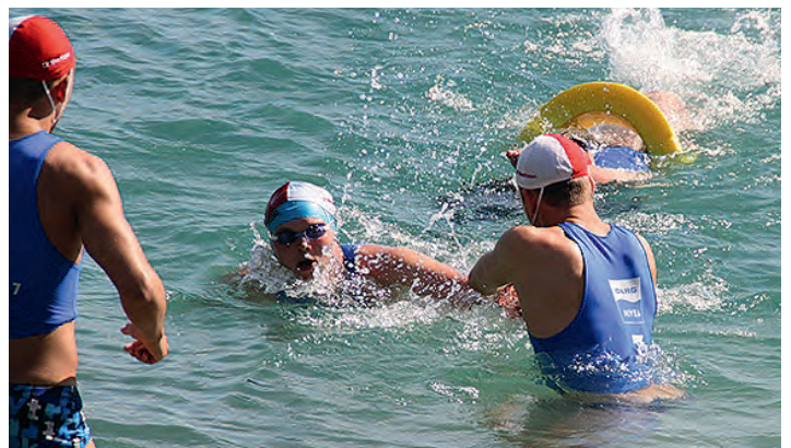
„Rescue Tube“ ist ein Rettungsgerät, mit dem der Ertrinkende wie in einem Schwimmreifen abgeschleppt wird. Helfer ziehen den Geretteten vollends an Land. Im Wettkampf wird die Teamarbeit auf Zeit mitbewertet