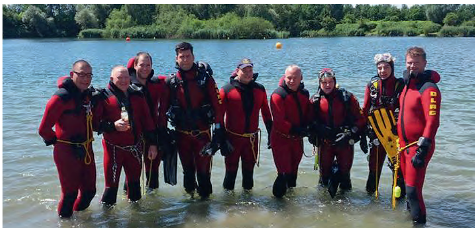
Taucheinsatz während des Blankenlocher Triathlon am Baggersee Blankenloch