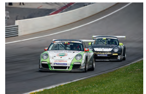
Hitzeschlacht bei über 30Grad bei der Sports Cup Endurance