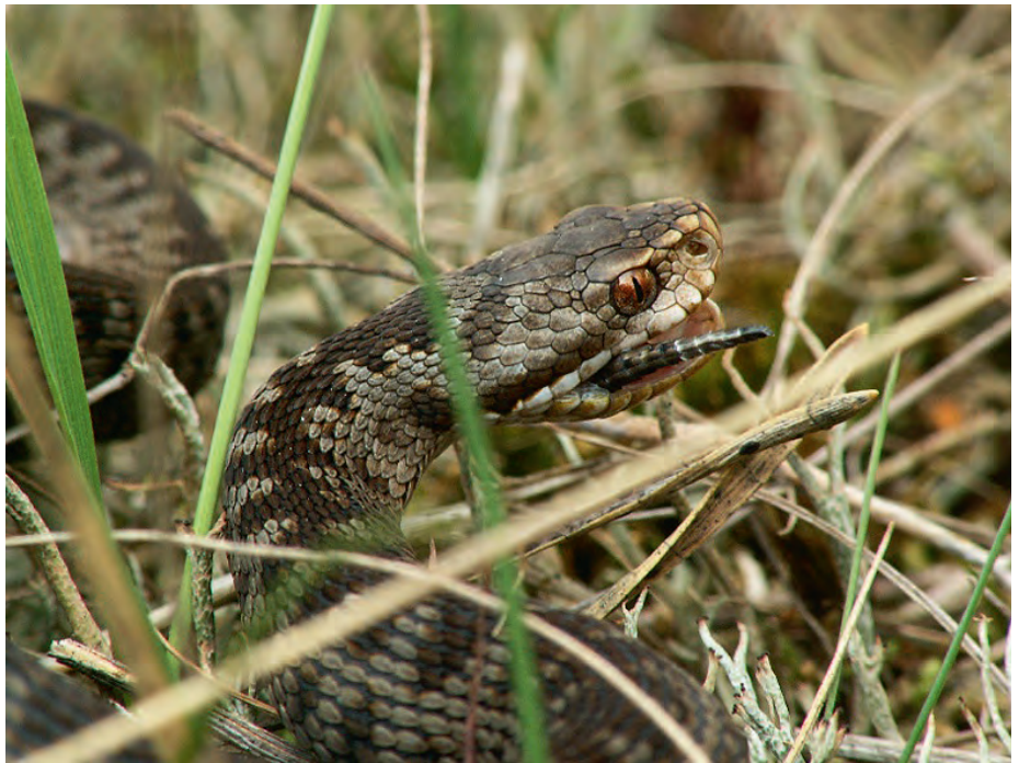
Die Kreuzotter frisst eine Eidechse