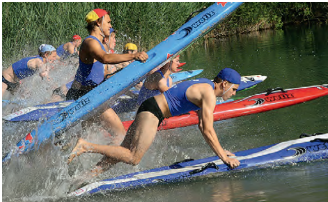
Bei „Board Race“ ist kräftiges Paddeln mit den Armen angesagt. Die Entfernung zum „Opfer“ beträgt im Wettkampf 600 Meter

Am Wochenende wurde im Durlacher Turmbergbad und am Weingartener Baggersee der zehnte bundesweite DLRG-Junioren Rettungspokal ausgetragen. 140 Jungen und Mädchen zwischen 14 und 18 Jahren aus 13 Landesverbänden nahmen teil. Der Tag in Weingarten galt den Freiwasserdisziplinen und begann mit „Board Race“ für Herren. „Board Race“ bedeutet, auf einem Rettungsbrett kniend und mit den Armen paddelnd eine 600 Meter lange Strecke zurückzulegen. Noch spannender ist der Wettkampf „Rescue Tube“.