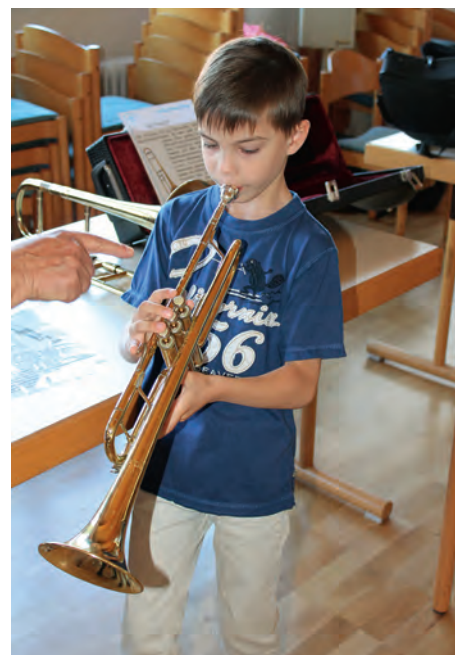
Bei der Instrumentenvorstellung durften die Kinder alle Instrumente selbst ausprobieren.

Weitere Informationen unter www.musikverein-weingarten.de