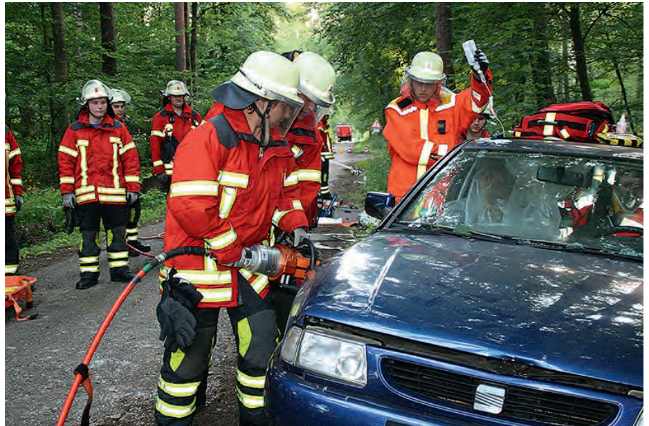
Mit dem hydraulischen Spreizer wird die Fahrzeugtür aufgehebelt

Die Einsatzleiter von Feuerwehr und Rot-