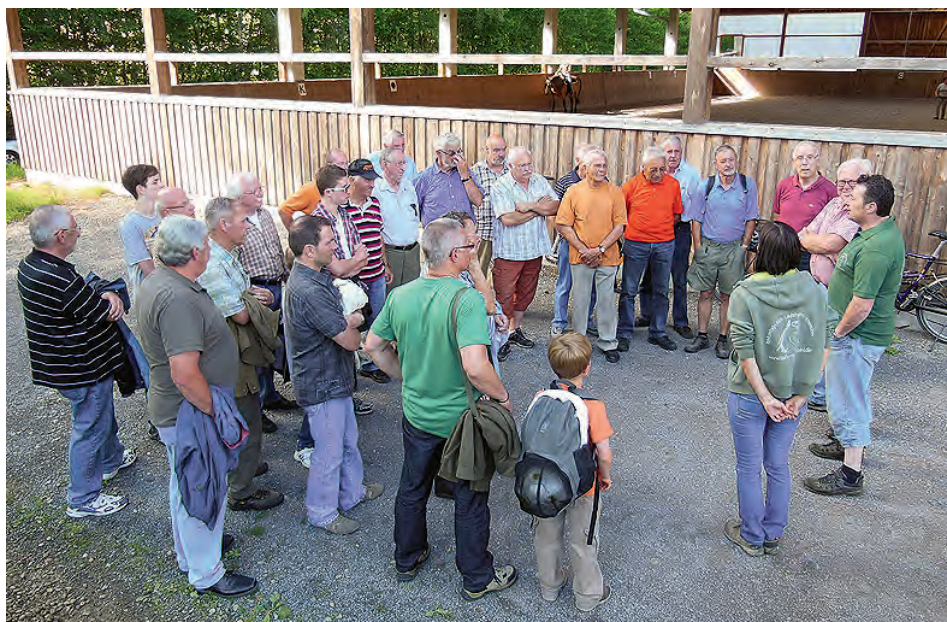
Die Sänger des Gesangsvereins Frohsinn auf dem Pferdehof in der Sohlsiedlung