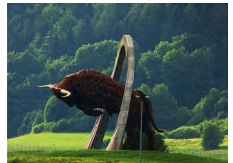
Imposanter Bulle ziert seit diesem Jahr den Red Bull Ring