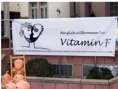
Vitamin F-Banner am Kreativmarkt

13.10.12: 47. Frauenfrühstück - 20jähriges Jubiläum von Vitamin F mit der Frauenkabarettgruppe „Marie & Sophie“ aus Königsbach SuBü