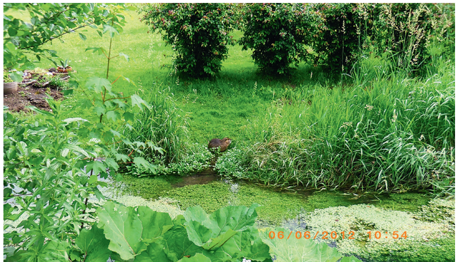
Ein Nutria wurde am Schlossbergsee gesichtet

Die Tiere finden als Pflanzenfresser genug Nahrung und lassen Brotreste und anderes liegen, was lediglich Ratten auf den Plan ruft.