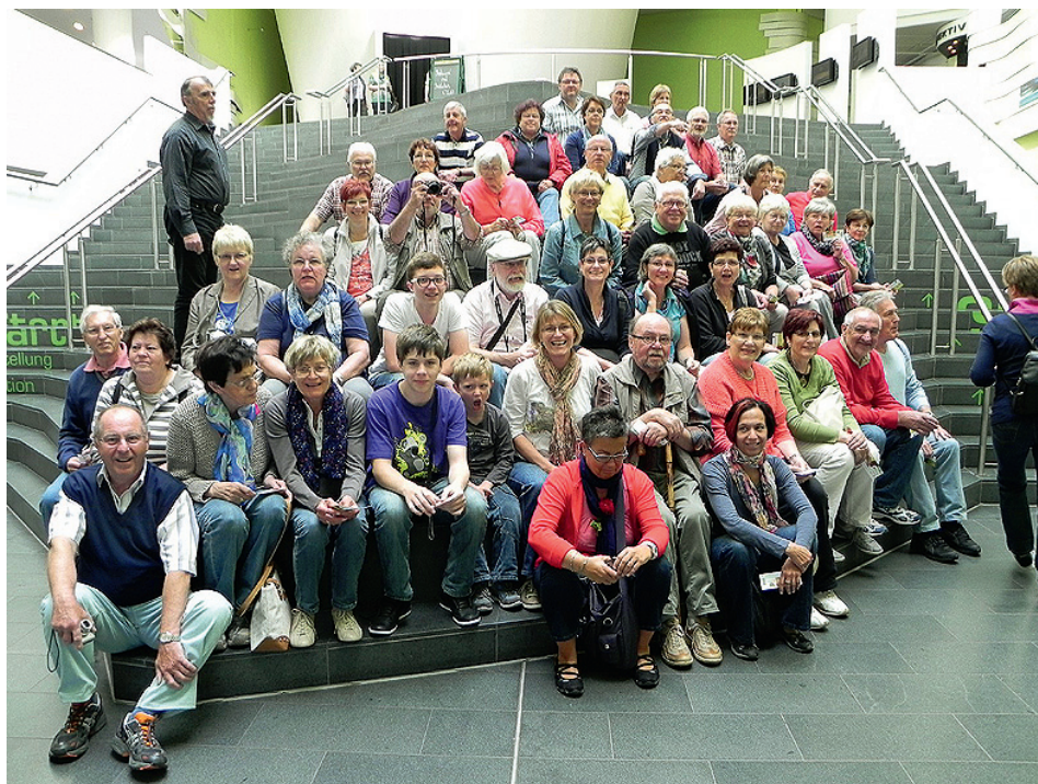
Gruppenfoto der Frohsinn-Ausflügler

Am 2. Tag stand eine Bremer Stadtbesichtigung (diesmal bei Tageslicht) auf dem Programm. Nach dem Treffpunkt beim Roland, einem der Bremer Wahrzeichen, wurden wir von unserem kenntnisreichen und launigen Stadtführer durch die Altstadt gelotst. Besonders beeindruckend der Dom St. Petri - romanisch aus dem 11. Jahrh., später als spätgotische Hallenkirche ausgebaut, ferner das im Stil der Gotik und Weser-Renaissance erbaute Rathaus, welches als Weltkulturerbe der UNESCO gilt, und das Kaufmannshaus „Schütting“ am Markt.