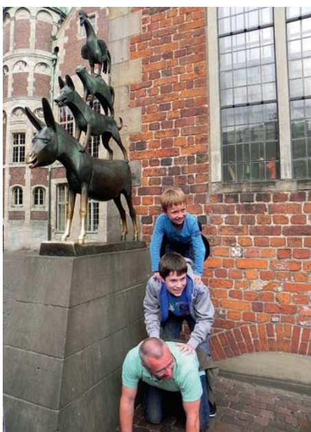
Die „frohsinnigen“ Bremer Stadtmusikanten.