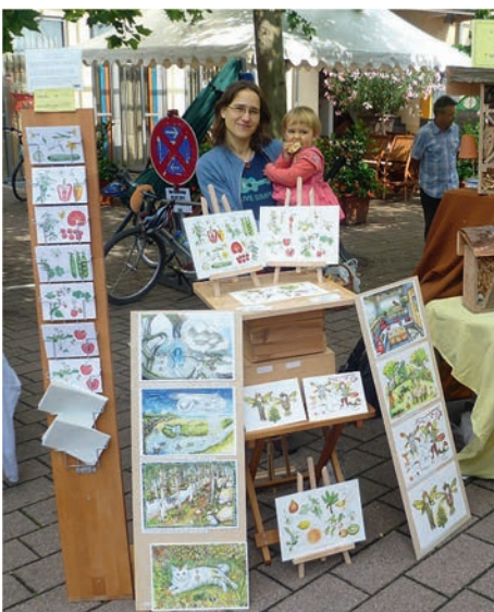
Stand am Kreativmarkt