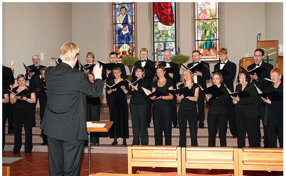
Kammerchor der Christuskirche Karlsruhe zu Gast in der ev. Kirche. Ein Sonderkonzert der „Weingartner Musiktage“ im Rahmen des „Jahres der Kirchenmusik“

Wie sagte ein Zuhörer? „Romantik darf man nicht den schlechten Chören überlassen.“