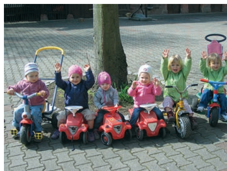
MiniClub-Kids in Aktion

Neugierig? Weitere Infos erhalten Sie unter www.allerdings-weingarten.de oder kommen Sie am ersten Montag des