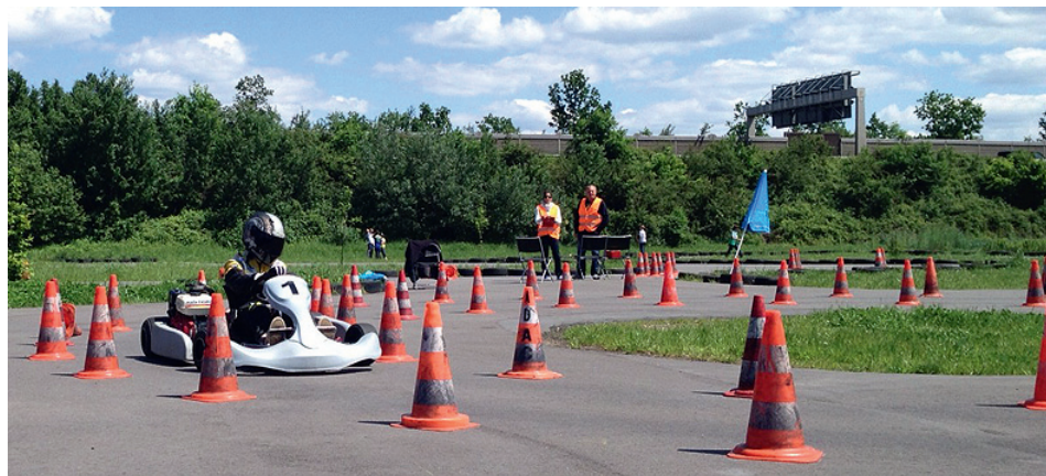
Jugendkartschlalom in Oberflockenbach