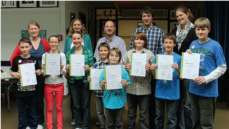
Das Juniorabzeichen ist die erste Stufe in der musikalischen Ausbildung. Hier die erfolgreichen Absolventen 2012