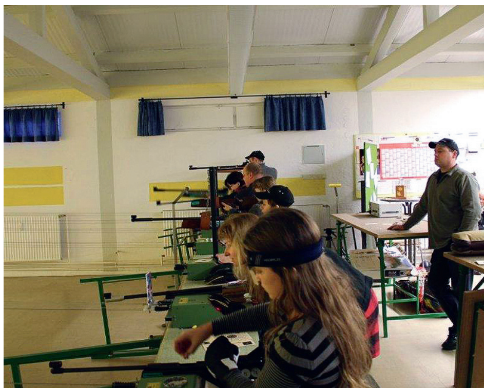
Starker Andrang beim Turnier