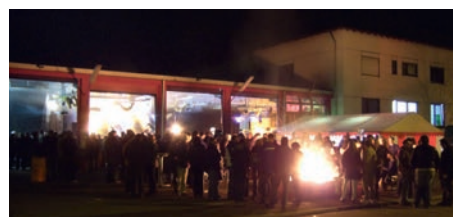
stimmungsvolle Atmosphäre vor dem Feuerwehrhaus