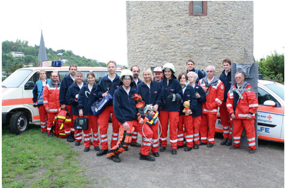
Bereitschaft DRK Weingarten (Baden)

Das nächste Blutspenden findet am 28. März .2012 in der Aula der Turmbergschule statt. Zwischen 14:30 - 19:30 Uhr empfangen wir Sie herzlichst. Weitere Termin können Sie direkt beim Blutspendedienst unter der kostenlosen Hotline 0800 11 949 11 oder unter www.blutspende.de erfahren.