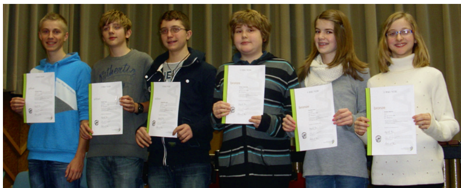
Die erfolgreichen Absolventen des Jugendmusikerleistungsabzeichens