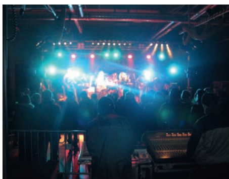
Blick auf die Bühne