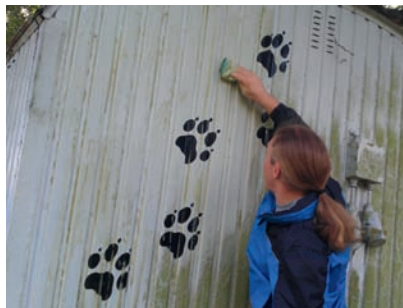
Spätjahrsputz auf dem Hundeplatz

Wir freuen uns immer über Besuch und Interessenten. Weitere Informationen gibt Jürgen Stiller, 07257/931422