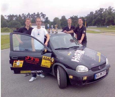
Unsere Slalom-Truppe wieder erfolgreich