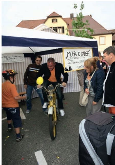
Mofa oa dabbe