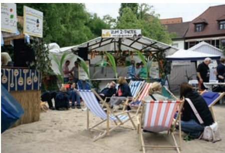
Playa de Walzbach