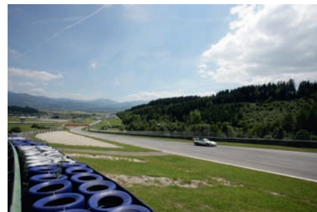
Toller Motorsport vor grandiosem Panorama