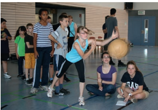
„Auch einen Medizinball weit zu werfen gehört zur Judo-Safari“

Jedoch geht es in diesem Wettbewerb nicht nur um Judo, sondern auch ein kreativer Teil und Elemente aus der Leichtathletik gehören dazu. „Kinder sollen in diesem Alter noch nicht spezialisiert sein“,