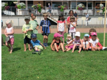
Unsere Turnkücken beim Gaukinderturnfest 2011

„Was kannst Du“-Parcour, der unter dem Motto „Ein Besuch im Märchenland“ stand, mussten unsere Turnkücken an 4 Stationen innerhalb einer bestimmten Zeit klettern, balancieren, rennen und ihre Geschicklichkeit unter Beweis stellen. Angefeuert von sämtlichen mitgereisten Eltern absolvierten unsere 13 Turn-Kinder ihre Sache mit Bravour und wurden mit Medaillen und Urkunden belohnt. Eine tolle Erfahrung mit ganz vielen positiven Elementen - ganz sicher sind wir nächstes Jahr wieder mit dabei!