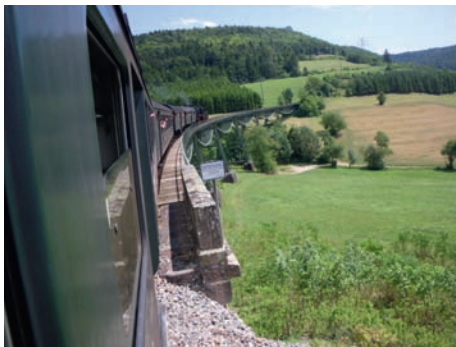
Herrliche Blicke in die Landschaft aus der Sauschwälebahn

Schon heute weisen wir auf unseren Beitrag für unsere Weingartener Jugend hin. Am Freitag, den 05.09.11 , laden wir wieder zur beliebten Nachwanderung mit Lagerfeuer ein. Wir treffen uns um 20:00 Uhr am Rathausplatz und wandern zum Höfhorst, wo .... Als Begleitpersonen brauchen wir wieder Omas und Opas - haltet Euch bitte bereit !