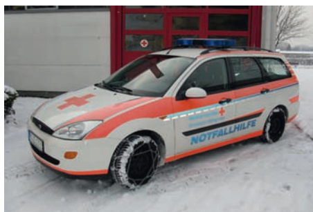
Einsatzfahrzeug im Winterdienst

Am 26.07. um 20:00 Uhr ist wieder ein Dienstabend im DRK Heim.