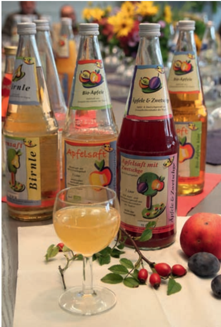
Wer kennt sie nicht? Die leckeren Obstsäfte sind die bekanntesten und beliebtesten Botschafter der Streuobstinitiative im Stadt- und Landkreis Karlsruhe.

Cent in der Kulturlandschaft ankomme. Er rief deshalb zum gemeinsamen Handeln auf, da die Streuobstwiesen gerade in Baden-Württemberg heimatliche Identität bedeuten. Neueste Aktivitäten der Initiative ist die Unterstützung des Steinkauzes, des Patenvogels des Landkreises der landesweiten Aktion 111-Arten-Korb sowie die Unterstützung und Förderung der Wildbienen, denen nach dem allgemeinen Rückgang der Imkerei für das Bestäuben der Obstbäume eine verstärkte Rolle zukommt.