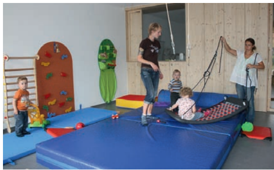
Der Aktionsraum ist einer von vielen funktionalen Räumen der Kindertagesstätte „Kleine Strolche“ in der Kanalstraße

Dazu sind die Räume den späteren Schulfächern zugeordnet. So gibt es beispielsweise einen Raum für Mathematik und Naturwissenschaften