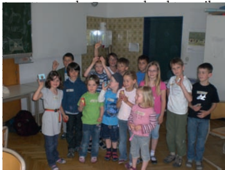
Die Teilnehmer des Theoriekurses mit ihren selbst gebauten Instrumenten

Danach schauten wir erst einmal, ob wir uns das Gelernte vom letzten Mal gemerkt hatten. Wir wiederholten, was es für Notenwerte gibt und wie man schnell und langsam zu Musik läuft. Dabei kamen wieder die Klanghölzer und Rasseln zum Einsatz.