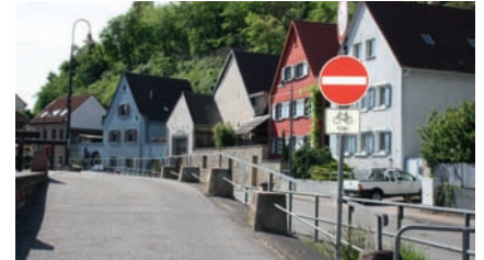
Hier sollten Sie nicht durchfahren!

Zugegeben, manchmal ist die Situation schon verführerisch: „Wenn ich nur schnell ein paar Meter weit durch diese Straße fahre, erspart mir das den Umweg um den ganzen Block“ denkt sich der Autofahrer. Deutlich sieht er das rote Schild mit dem weißen Balken vor sich, das eigentlich jeder kennt und das „Verbot der Einfahrt“ bedeutet. - „Was soll den schon dabei sein? Weit und breit ist kein Gegenverkehr zu sehen, also nix wie los.“ Tatsächlich, er kommt unbeschadet durch. Nach dem Motto „Einmal ist keinmal“ probiert er es beim nächsten Mal wieder.