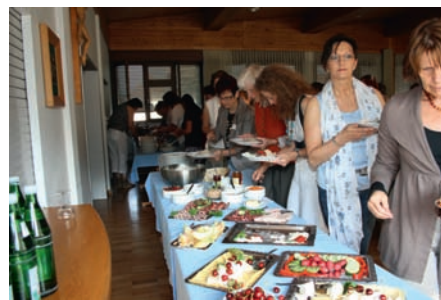
Ein super Frühstück ist der Auftakt für einen gelungenen Vormittag bei Vitamin F

Zu hören ist dann in der Regel ein Referat, das Frauen hilft, sich mit sich selbst auseinanderzusetzen, eigene Kräfte zu entdecken, Wege zu finden, mit Schwierigkeiten und Problemen der momentanen Situation leichter umzugehen. Die Palette der Themen ist vorwiegend an den nicht mehr ganz Jungen orientiert, sondern eher am Status der reiferen Frau und spricht vorwiegend ihre psychologisch-soziale Komponente an. Es geht um Selbstsicherheit und