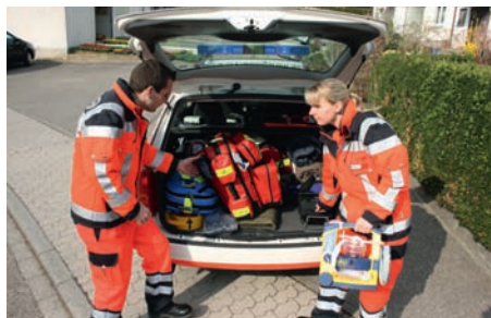
Materialentnahme aus dem Einsatzfahrzeug

Lesen Sie nächste Woche: Die NOTFALLHILFE übernimmt die Erstversorgung bis zum Eintreffen des Rettungswagens.